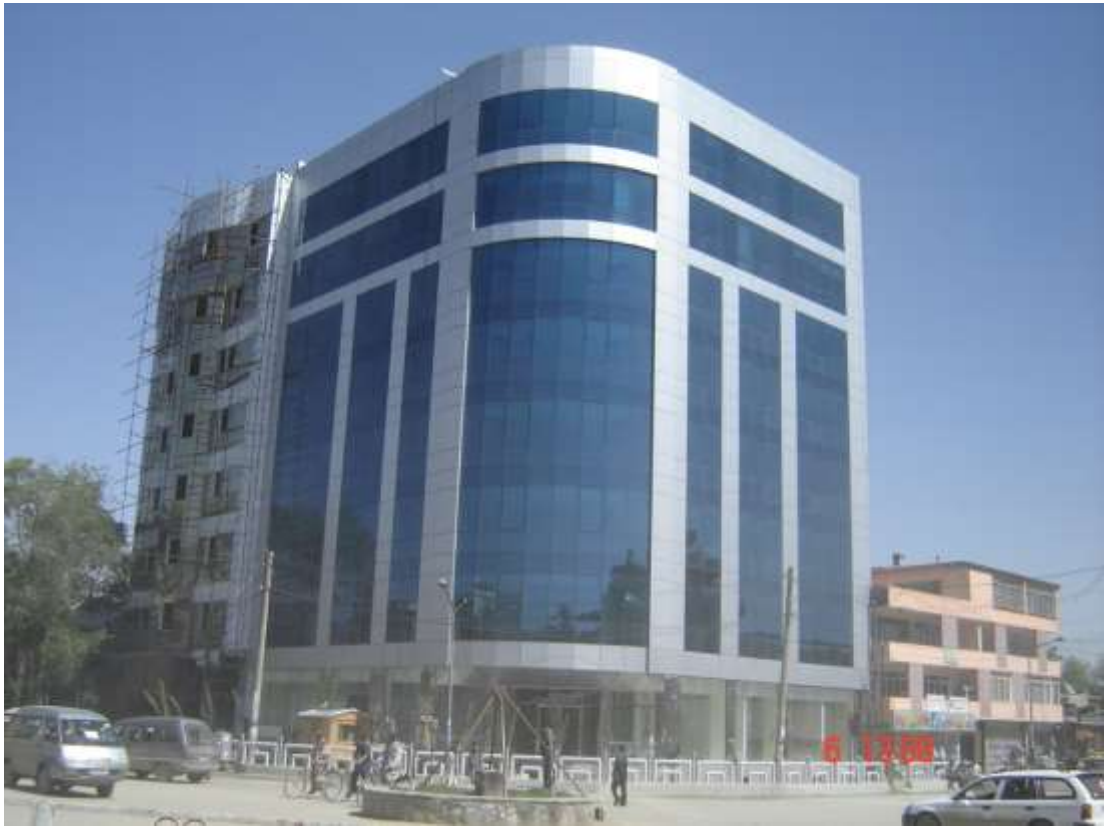
فروشگاه بزرگ افغان