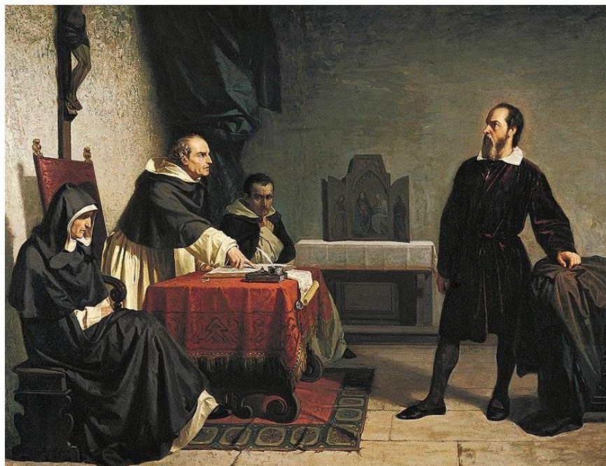
گالیله در دادگاه تفتیش عقاید

ویکی پیدیا زیر عنوان «محاكمه گالیله در کلیسا» شرح می‌دهد: